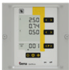
Control de ejes OptiMove