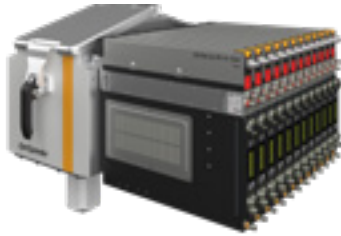
Integración de OptiSpray All-in-One en un OptiSpeeder (tolva de polvo) de un OC10

Las bombas de aplicación OptiSpray y OptiSpray All-in-One equipan de serie OptiCenter All-in-One (centro de gestión de polvo), que aporta flexibilidad y los mejores resultados de recubrimiento.