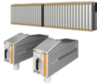
Integración de OptiSpray All-in-One en los dos OptiSpeeders de un OC11 (tecnología DualSpeeder)