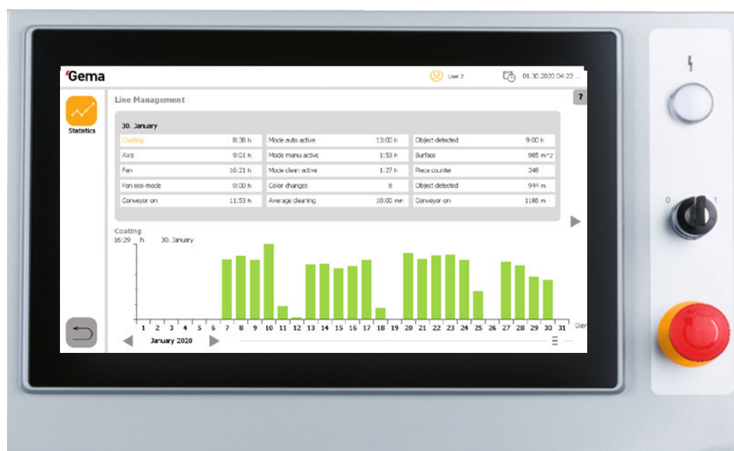
Visualización inequívoca de los datos de producción en MagicControl 4.0

Esto ofrece al usuario una comprensión más profunda de la utilización y la eficiencia de la línea y permite reconocer el potencial de mejora de la logística de producción, llevar a cabo optimizaciones de los procesos y aumentar la disponibilidad de la línea y, por último, la productividad.