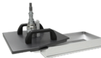
L'US07-01 è utilizzato nell'OptiCenter OC09.