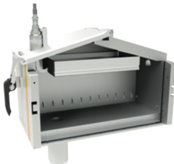
US07 integrato nella tramoggia della polvere OptiSpeeder