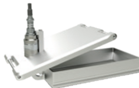
L'US07 è compatibile con le serie OptiCenter All-in-One OC06, OC10 e OC11 e con gli OptiCenter OC07 e OC08.