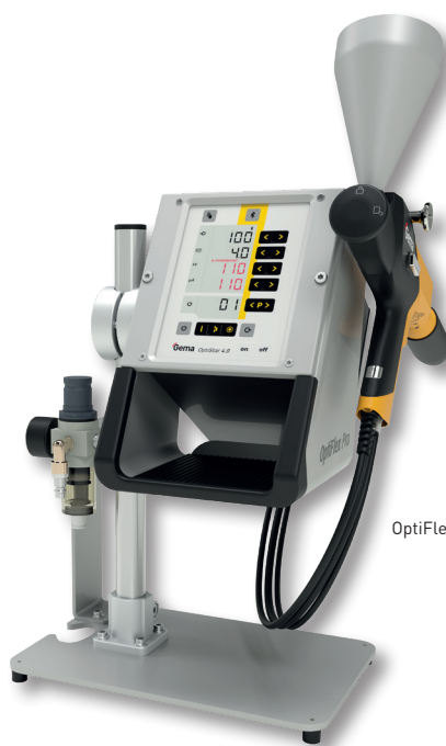
OptiFlex Pro CF come unità da tavolo