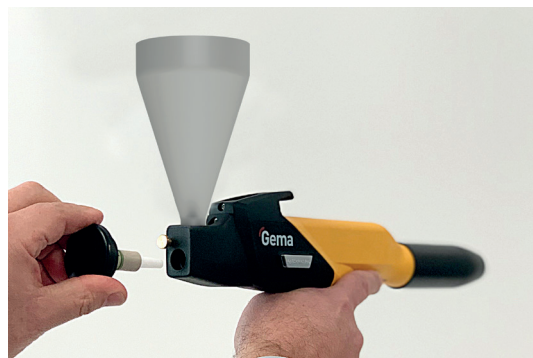
Fase di lavoro sul modulo iniettore (smontabile senza attrezzi)