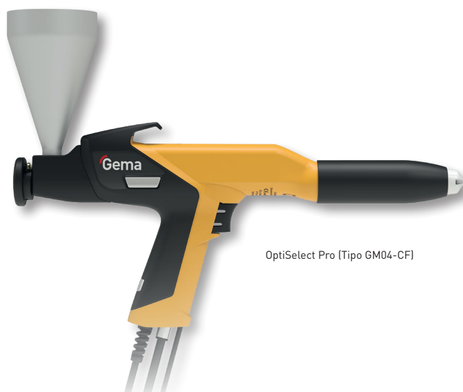
OptiSelect Pro (Tipo GM04-CF)

Your global partner for high quality powder coating