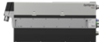
OptiSpray (AP02) Applikationspumpe