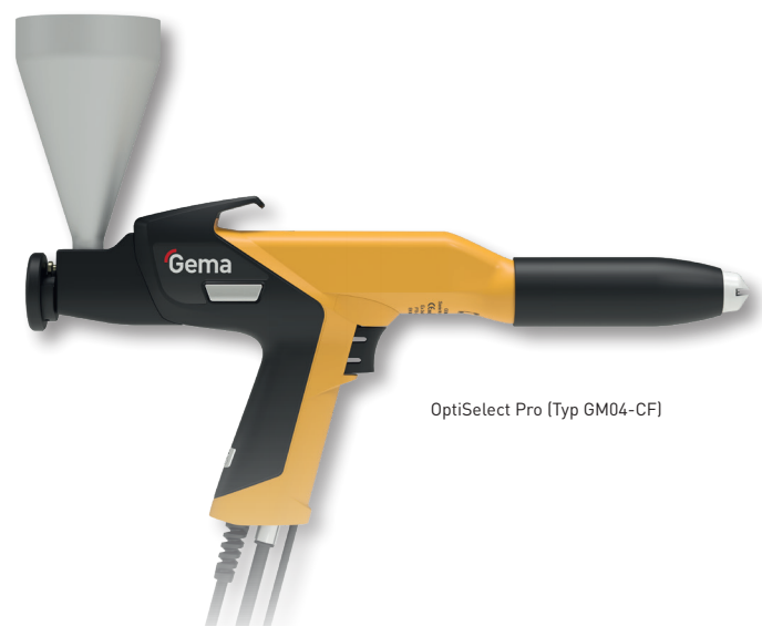
OptiSelect Pro (Typ GM04-CF)

Your global partner for high quality powder coating