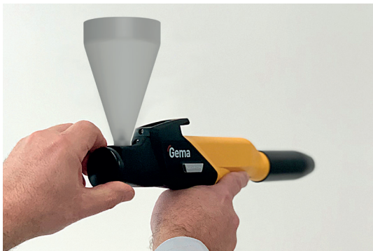
Handgriff am Injektormodul (werkzeuglose Zerlegung)