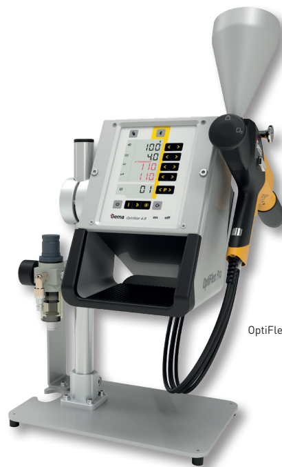
OptiFlex Pro CF als Tischgerät