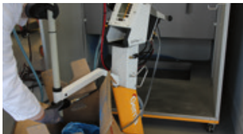
Fase 2: Sollevamento del pescante