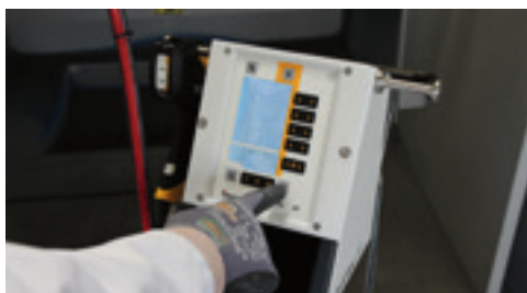
Fase 4: Inizio della fase di pulizia