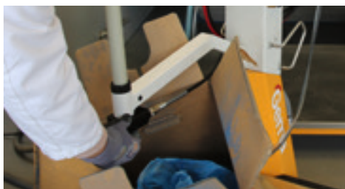
Fase 3: Posizionamento del modulo "QuickClean"