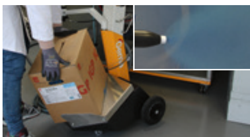
Fase 5: Cambio della scatola durante il ciclo di pulizia