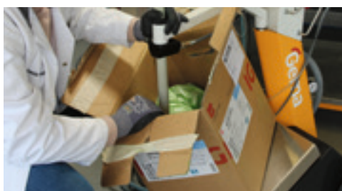
Fase 6: Posizionamento del pescante nella scatola con il nuovo colore